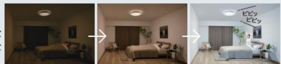
徐々に明るくなる光とアラームの音で起床時刻をお知らせ。(目覚めのあかり)