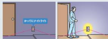
人が近づくと点灯。離れてし ばらくすると消える足元灯。 あとの眠りを妨げません。 (かかってにナイトライト)

シンクロ調色 : http://www2.panasonic.biz/es/lighting/home/synchro/