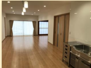
富山市戸建リフォームK様邸