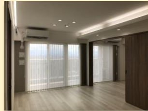
富山市マンションリフォームA様邸

今年一年間、PanasonicリフォームClubでリフォーム させてもらった、ほんの一例です！