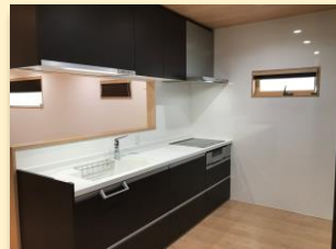
富山市戸建リフォームS様邸