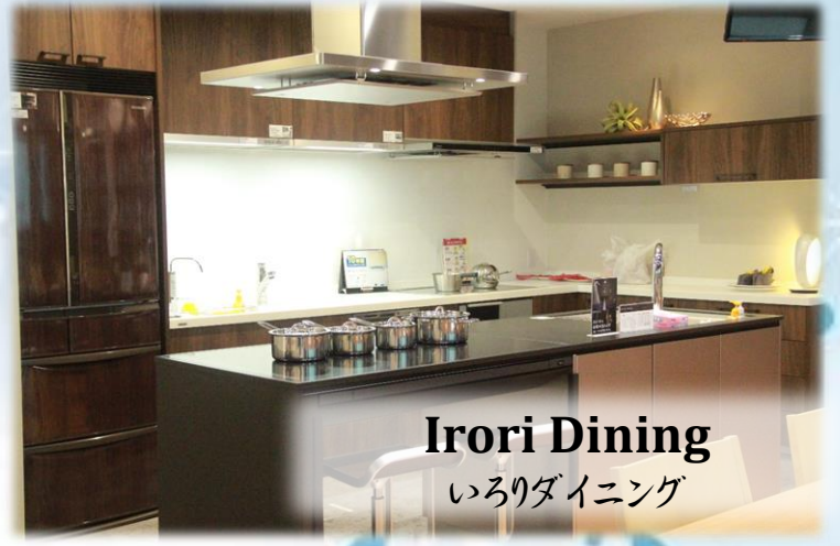
Irori Dining いろりダイニング