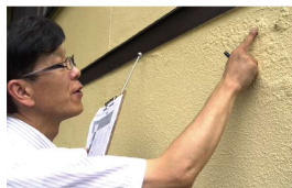
専用器具等を使って、綿密に診断します。