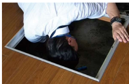
点検しにくい床下や小屋根、水廻りもチェック。