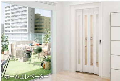
ホームエレベーター

上下階の移動がラクになるので、洗濯ものや布団を持って上がる時に便利です。ペットの移動にも役立ちます。